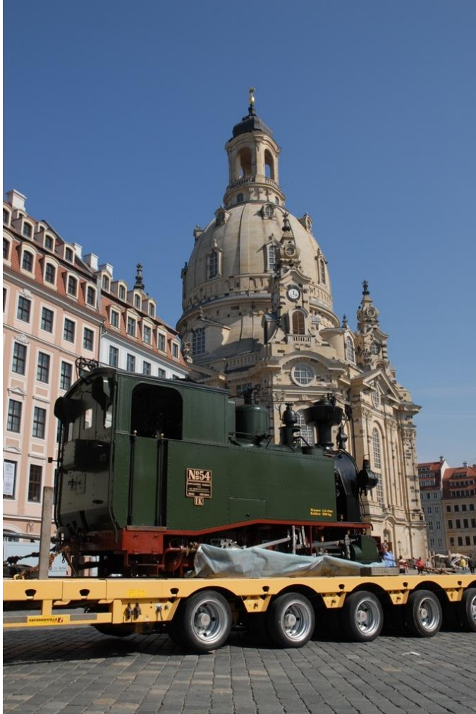
Zwei sächsische Wahrzeichen treffen zusammen, die I K Nr. 54, der Nachbau der ersten sächsischen Schmalspurlokomotivbaureihe bei der Vorbeifahrt an der Dresdner Frauenkirche auf dem Weg zum Dresdner Verkehrsmuseum