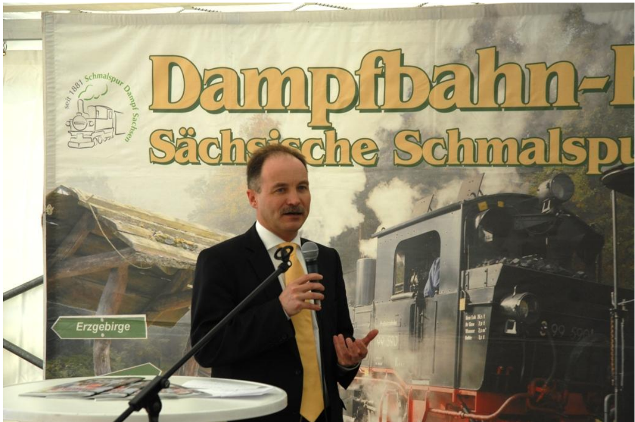
Der Sächsische Staatsminister für Wirtschaft, Arbeit und Verkehr bei seinem Grußwort zur Eröffnung der 2. Dresdner Dampfloktage